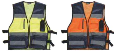
Marino/Amarillo A.V. Navy/H.V. Yellow