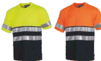
Amarillo A.V./Marino H.V. Yellow/Navy