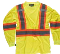
Amarillo A.V./Naranja A.V. H.V. Yellow/H.V. Orange