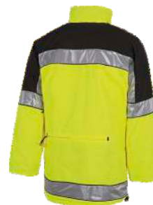
Amarillo A.V./Negro H.V. Yellow/Black