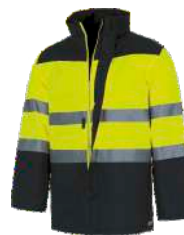
Amarillo A.V./Marino H.V. Yellow/Navy

Fleece with nylon zip closing. Turtle-neck. Elastic cuff. A chest pocket, and two lower ones. Combined with high visibility. A reflective tape on chest and back. Adjustable waist.