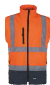
4) CHALECO A.V. HIGH VISIBILITY VEST