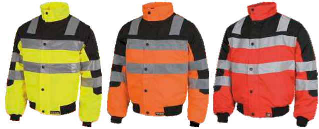
Amarillo A.V./Negro H.V. Yellow/Black