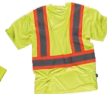
Amarillo A.V./Naranja A.V. H.V. Yellow/H.V. Orange