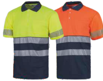
Amarillo A.V./Marino H.V. Yellow/Navy Naranja A.V./Marino H.V. Orange/Navy