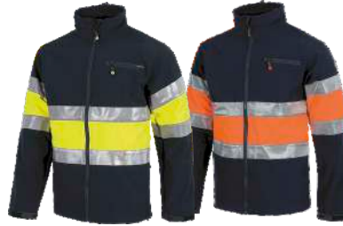
Marino/Amarillo A.V. Navy/H.V. Yellow