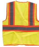
Amarillo A.V./Naranja A.V. H.V. Yellow/H.V. Orange