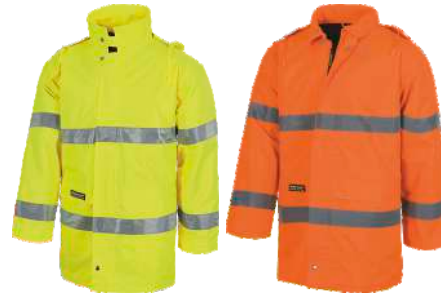
Amarillo A.V. H.V. Yellow