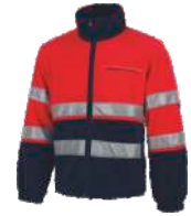
Rojo A.V./Marino H.V. Red/Navy