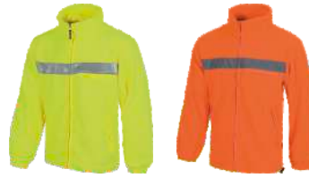
Amarillo A.V. H.V. Yellow