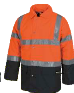
Naranja A.V./Marino H.V. Orange/Navy