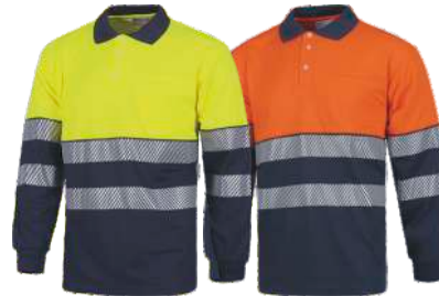
Amarillo A.V./Marino H.V. Yellow/Navy Naranja A.V./Marino H.V. Orange/Navy