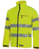
Amarillo A.V. H.V. Yellow