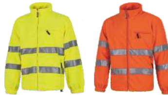
Amarillo A.V. H.V. Yellow