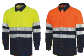
Amarillo A.V./Marino H.V. Yellow/Navy