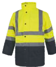
Amarillo A.V./Marino H.V. Yellow/Navy