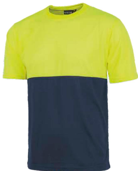
Amarillo A.V./Marino H.V. Yellow/Navy

Camiseta de manga corta. Cuello redondo. Combinada con alta visibilidad. Cintas reflectantes discontinuas termoadhesivas en pecho, espalda y mangas. Short sleeve T- Shirt. Round neck. Combined in high visibility. Dashed reflective tape on chest, back, and sleeves.