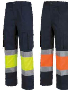
Marino/Amarillo A.V. Marino/Naranja A.V. Navy/H.V. Yellow Navy/H.V. Orange