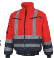
Rojo A.V./Marino H.V. Red/Navy