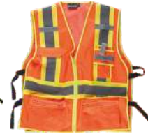
Naranja A.V./Amarillo A.V. H.V. Orange/H.V. Yellow