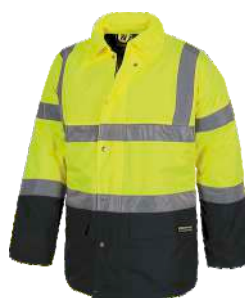
Amarillo A.V./Marino H.V. Yellow/Navy