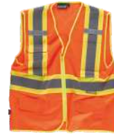
Naranja A.V./Amarillo A.V. H.V. Orange/H.V. Yellow