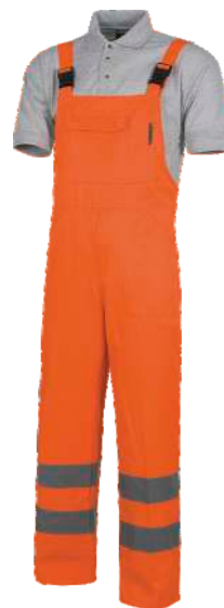
Naranja A.V. H.V. Orange