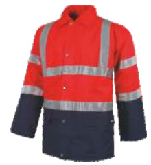
Rojo A.V./Marino H.V. Red/Navy