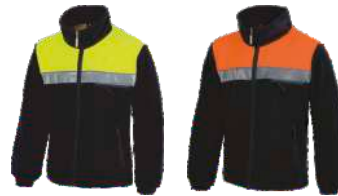
Marino/Amarillo A.V. Navy/H.V. Yellow