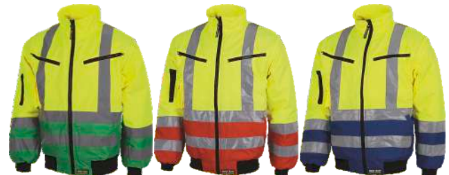
Amarillo A.V./Verde H.V. Yellow/Green