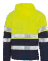
Marino/Amarillo A.V. Navy/H.V. Yellow