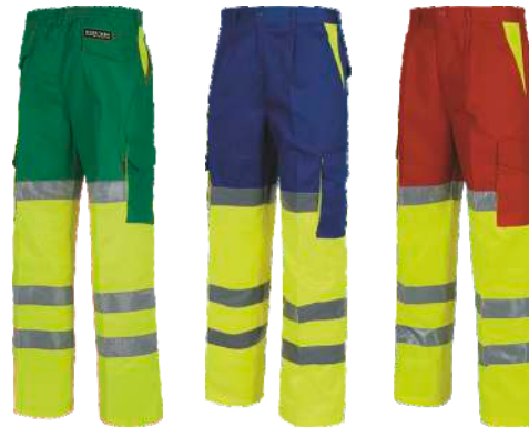
Verde/Amarillo A.V. Green/H.V. Yellow