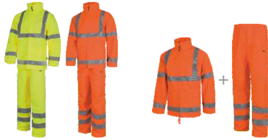
Amarillo A.V. H.V. Yellow