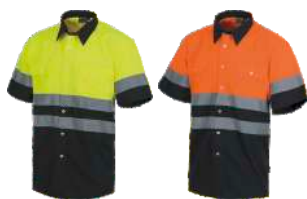
Amarillo A.V./Marino H.V. Yellow/Navy