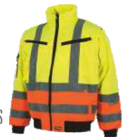
Amarillo A.V./Naranja A.V. H.V. Yellow/H.V. Orange