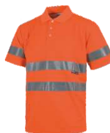
Naranja A.V. H.V. Orange