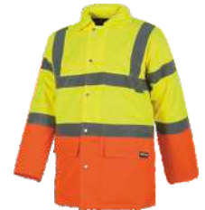
Amarillo A.V./Naranja A.V. H.V. Yellow/H.V. Orange