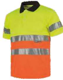
Amarillo A.V./Naranja A.V./Negro H.V. Yellow/H.V. Orange/Black