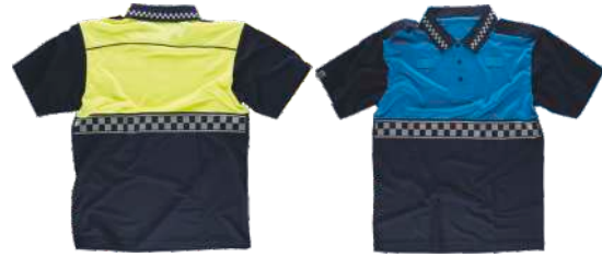
Marino/Amarillo A.V. Navy/H.V. Yellow