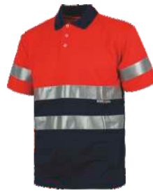
Rojo A.V./Marino H.V. Red/Navy