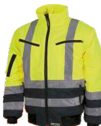
Amarillo A.V./Marino H.V. Yellow/Navy