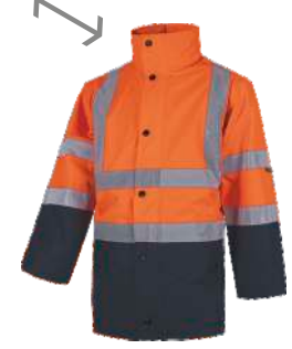
2) IMPERMEABLE WATERPROOF