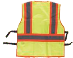
Amarillo A.V./Naranja A.V. H.V. Yellow/H.V. Orange