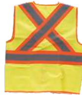
Amarillo A.V./Naranja A.V. H.V. Yellow/H.V. Orange