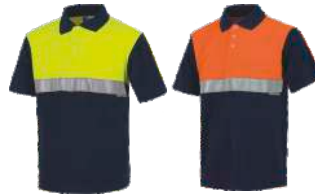
Marino/Amarillo A.V. Navy/H.V. Yellow Marino/Naranja A.V. Navy/H.V. Orange