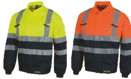
Marino/Amarillo A.V. Navy/H.V. Yellow