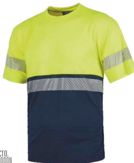
Amarillo A.V./Marino H.V. Yellow/Navy

Camiseta de manga corta. Cuello redondo. Short sleeve T- Shirt. Round neck.