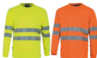
Amarillo A.V. H.V. Yellow