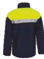
Marino/Amarillo A.V. Navy/H.V. Yellow