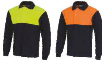
Marino/Amarillo A.V. Navy/H.V. Yellow