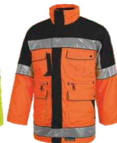
Naranja A.V./Negro H.V. Orange/Black