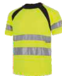
Amarillo A.V./Negro H.V. Yellow/Black