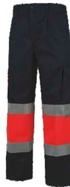
Marino/Rojo A.V. Navy/H.V. Red