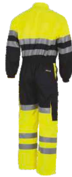
Marino/Amarillo A.V. Navy/H.V. Yellow