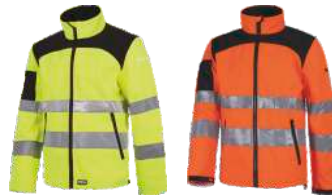
Amarillo A.V./Negro H.V. Yellow/Black