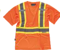
Naranja A.V./Amarillo A.V. H.V. Orange/H.V. Yellow