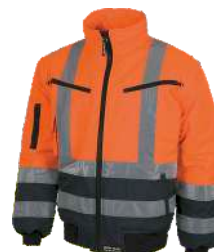
Naranja A.V./Marino H.V. Orange/Navy