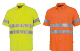
Amarillo A.V. H.V. Yellow