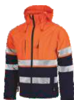
Marino/Naranja A.V. Navy/H.V. Orange