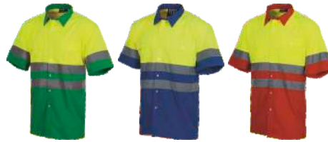
Amarillo A.V./Verde H.V. Yellow/Green