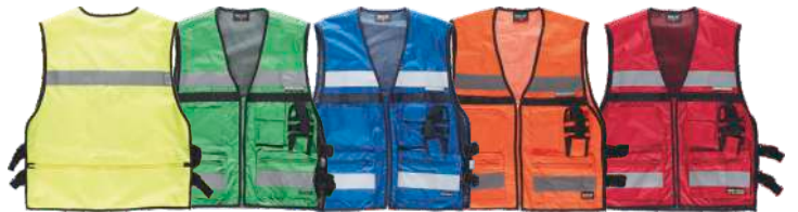
Amarillo A.V. H.V. Yellow