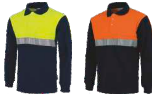
Marino/Amarillo A.V. Navy/H.V. Yellow