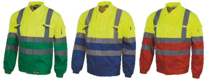
Verde/Amarillo A.V. Green/H.V. Yellow