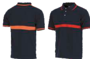
Marino/Naranja Navy/Orange Marino/Rojo Navy/Red