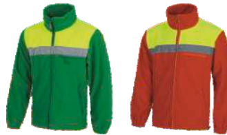
Verde/Amarillo A.V. Green/H.V. Yellow