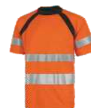
Naranja A.V./Negro H.V. Orange/Black