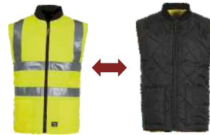
Amarillo A.V./Negro H.V. Yellow/Black