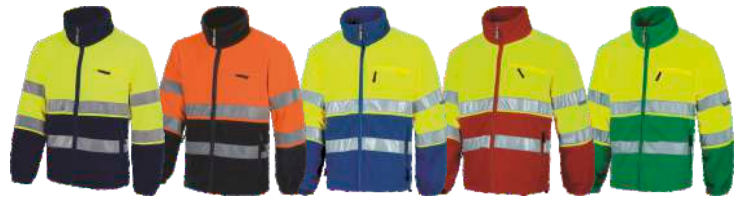
Marino/Amarillo A.V. Marino/Naranja A.V. Azulina/Amarillo A.V. Rojo/Amarillo A.V. Verde/Amarillo A.V. Navy/H.V. Yellow Navy/H.V. Orange Royal/H.V. Yellow Red/H.V. Yellow Green/H.V. Yellow