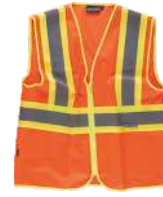
Naranja A.V./Amarillo A.V. H.V. Orange/H.V. Yellow