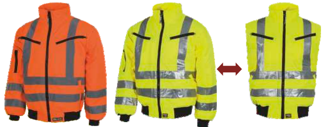
Naranja A.V. H.V. Orange