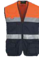
Marino/Naranja A.V. Navy/H.V. Orange