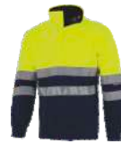
Amarillo A.V./Marino H.V. Yellow/Navy