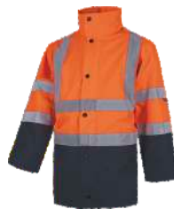
Naranja A.V./Marino H.V. Orange/Navy