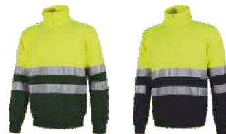
Amarillo A.V./Verde Oscuro H.V. Yellow/Dark Green