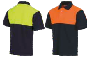
Marino/Amarillo A.V. Navy/H.V. Yellow Marino/Naranja A.V. Navy/H.V. Orange