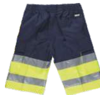
Marino/Amarillo A.V. Navy/H.V. Yellow