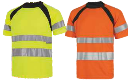
Amarillo A.V./Negro H.V. Yellow/Black