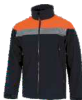
Marino/Naranja A.V. Navy/H.V. Orange