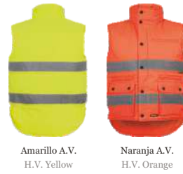
Amarillo A.V. H.V. Yellow