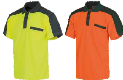
Amarillo A.V./Gris Oscuro H.V. Yellow/Dark Grey