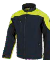
Marino/Amarillo A.V. Navy/H.V. Yellow