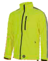
Amarillo A.V. H.V. Yellow