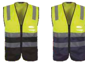
Amarillo A.V./Negro H.V. Yellow/Black