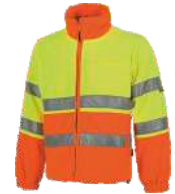
Amarillo A.V./Naranja A.V. H.V. Yellow/H.V. Orange