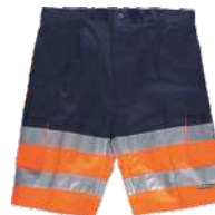
Marino/Naranja A.V. Navy/H.V. Orange