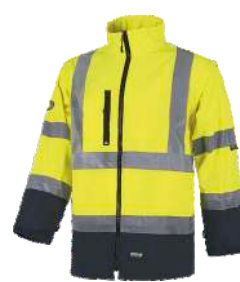
3) SHOFTSHELL SHOFTSHELL