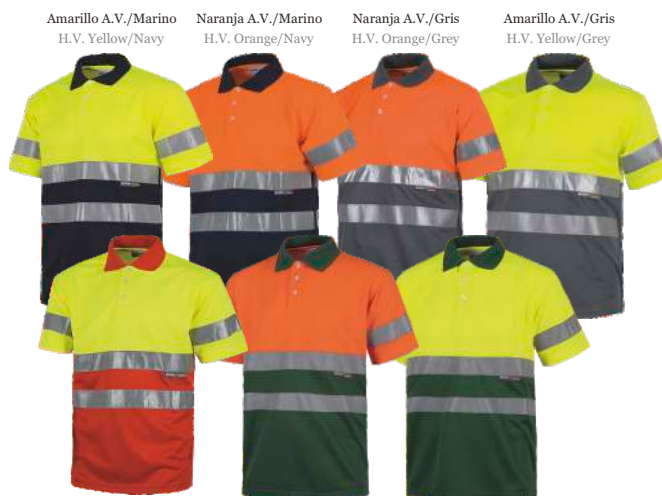
Amarillo A.V./Marino H.V. Yellow/Navy