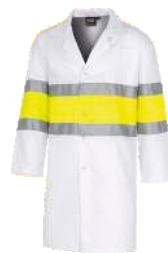
Blanco/Amarillo A.V. White/H.V. Yellow