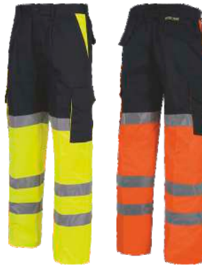
Marino/Amarillo A.V. Navy/H.V. Yellow