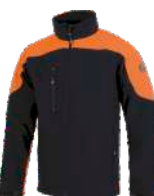
Marino/Naranja A.V. Navy/H.V. Orange