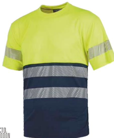
Amarillo A.V./Marino H.V. Yellow/Navy

Camiseta de manga corta. Cuello redondo. Combinada con alta visibilidad. Short sleeve T- Shirt. Round neck. Combined in high visibility.