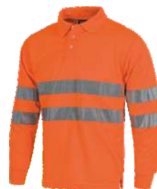
Naranja A.V. H.V. Orange