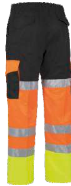
Amarillo A.V./Naranja A.V./Negro H.V. Yellow/H.V. Orange/Black