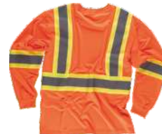
Naranja A.V./Amarillo A.V. H.V. Orange/H.V. Yellow