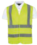
Amarillo A.V. H.V. Yellow