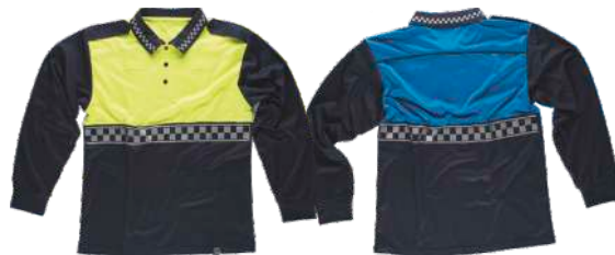
Marino/Amarillo A.V. Navy/H.V. Yellow