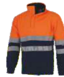
Naranja A.V./Marino H.V. Orange/Navy