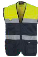
Marino/Amarillo A.V. Navy/H.V. Yellow