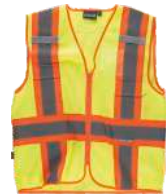
Amarillo A.V./Naranja A.V. H.V. Yellow/H.V. Orange