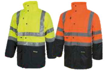
Amarillo A.V./Marino H.V. Yellow/Navy