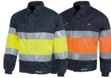
Marino/Amarillo A.V. Marino/Naranja A.V. Navy/H.V. Yellow Navy/H.V. Orange