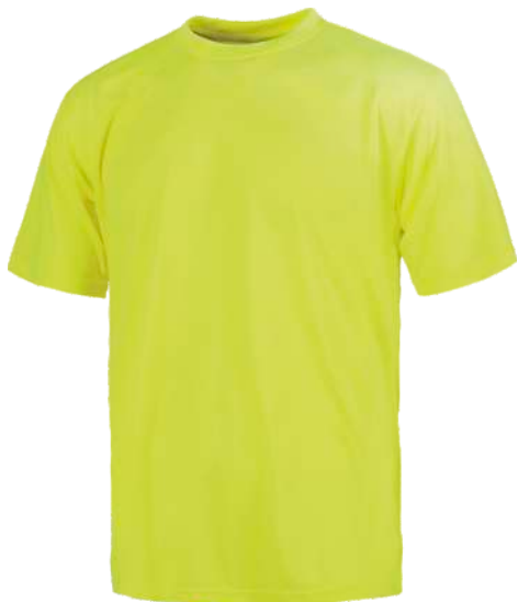
Amarillo A.V. H.V. Yellow