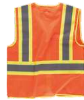
Naranja A.V./Amarillo A.V. H.V. Orange/H.V. Yellow