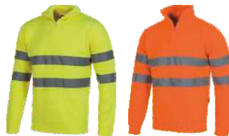
Amarillo A.V. H.V. Yellow