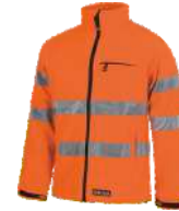
Naranja A.V. H.V. Orange