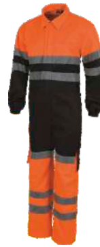
Marino/Naranja A.V. Navy/H.V. Orange