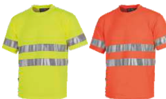
Amarillo A.V. H.V. Yellow