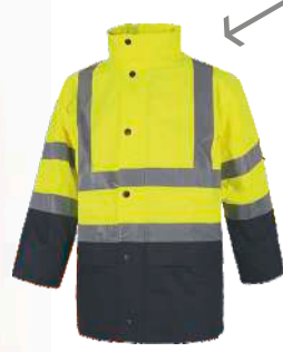
1) PARKA PARKA